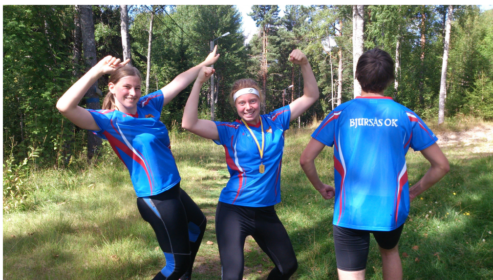
Bjursås Ok:s nya OL-blus